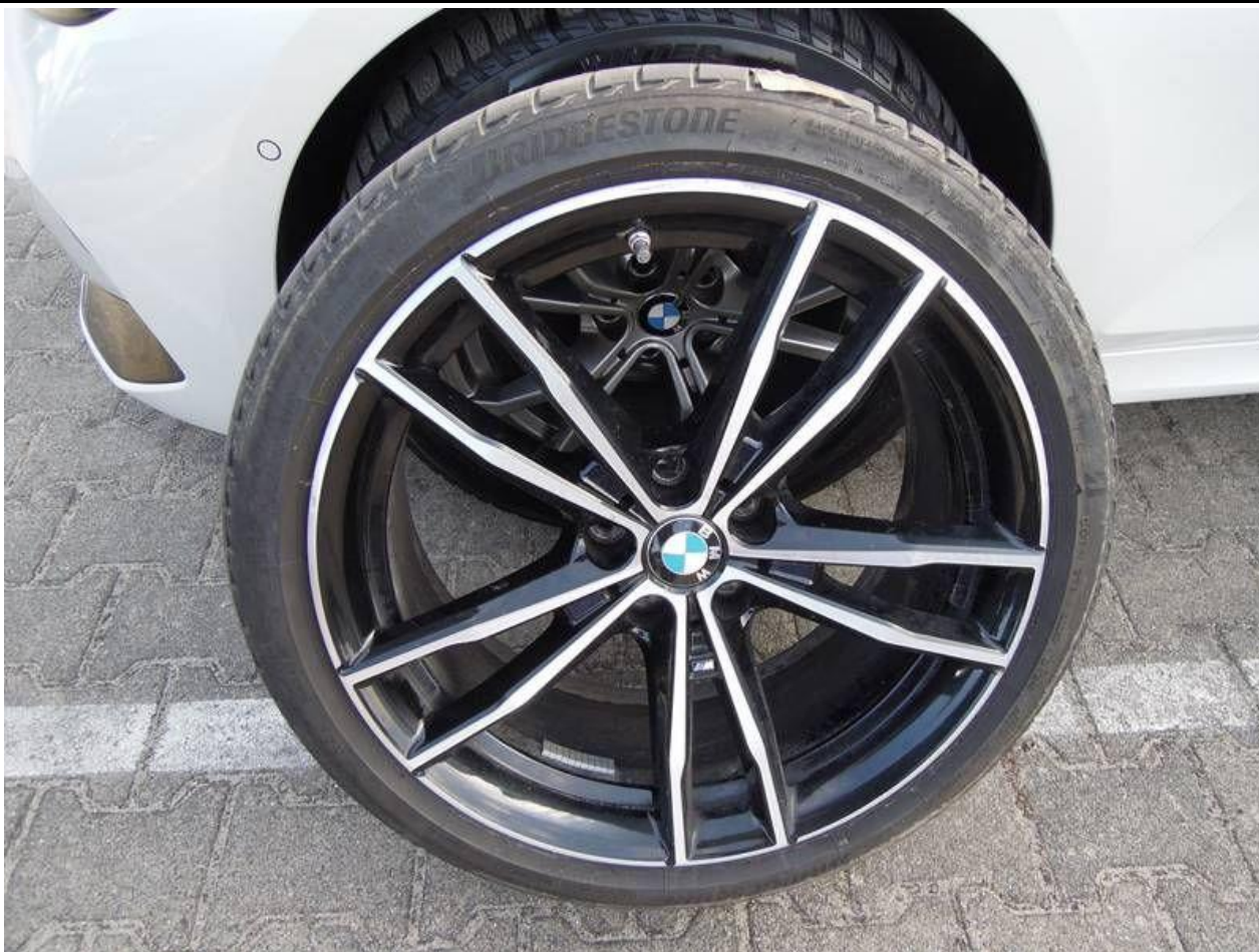
Fot. nr 49