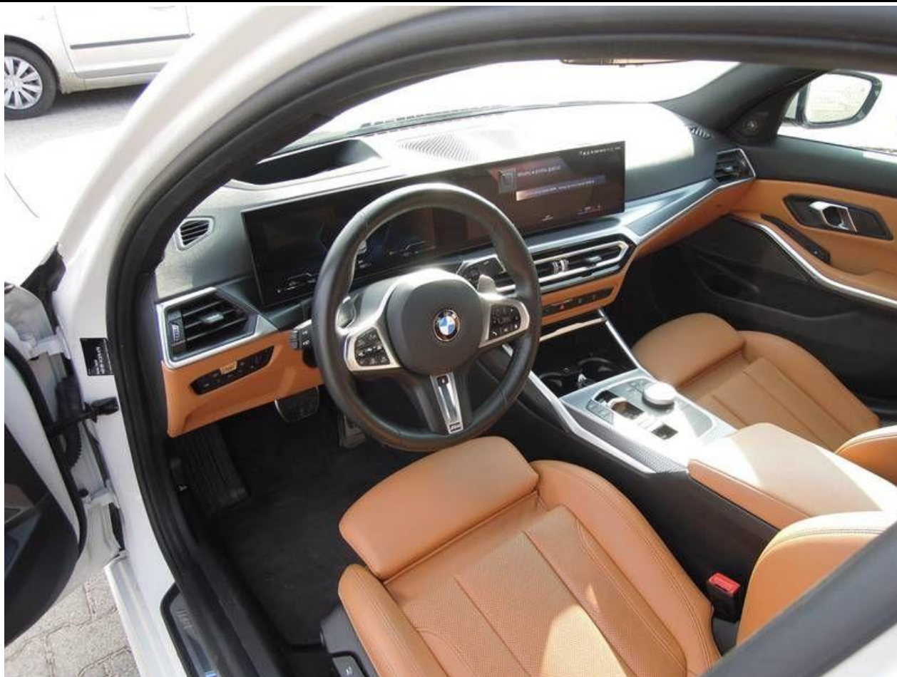
Fot. nr 15