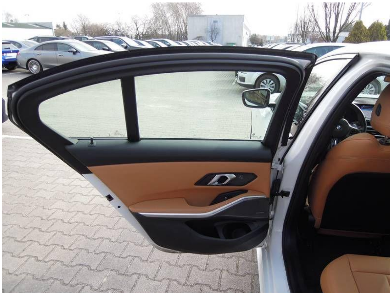
Fot. nr 16