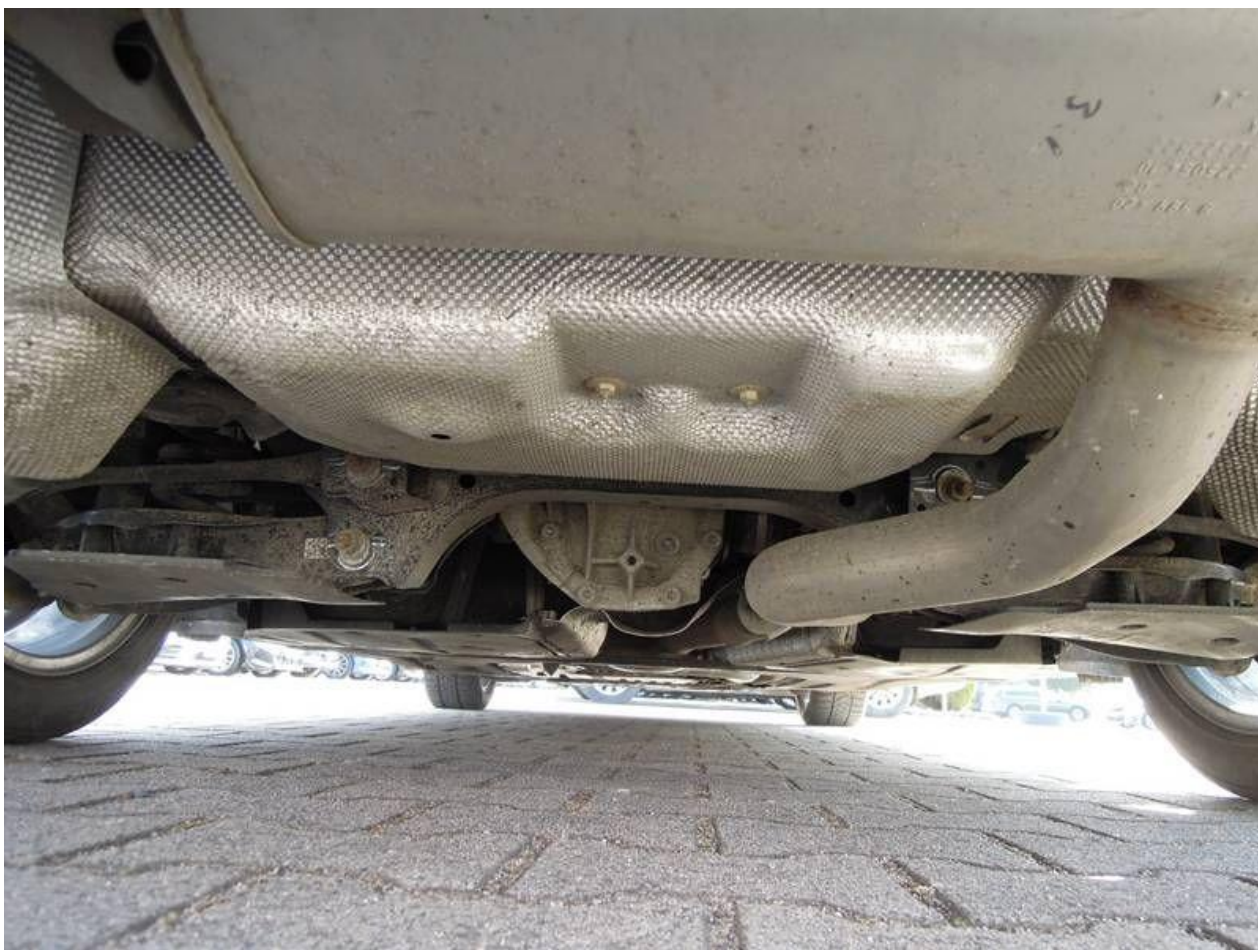
Fot. nr 46