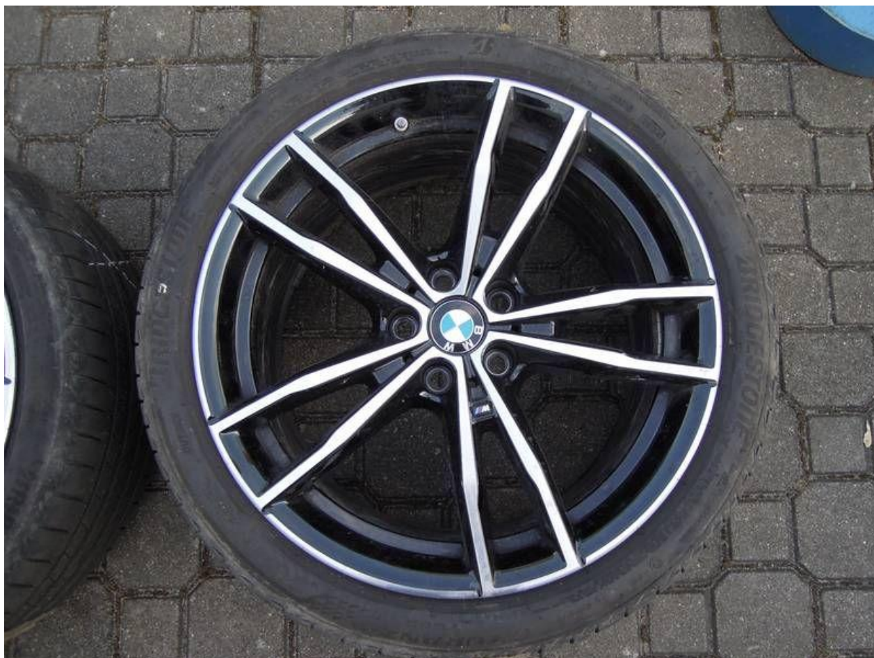
Fot. nr 52