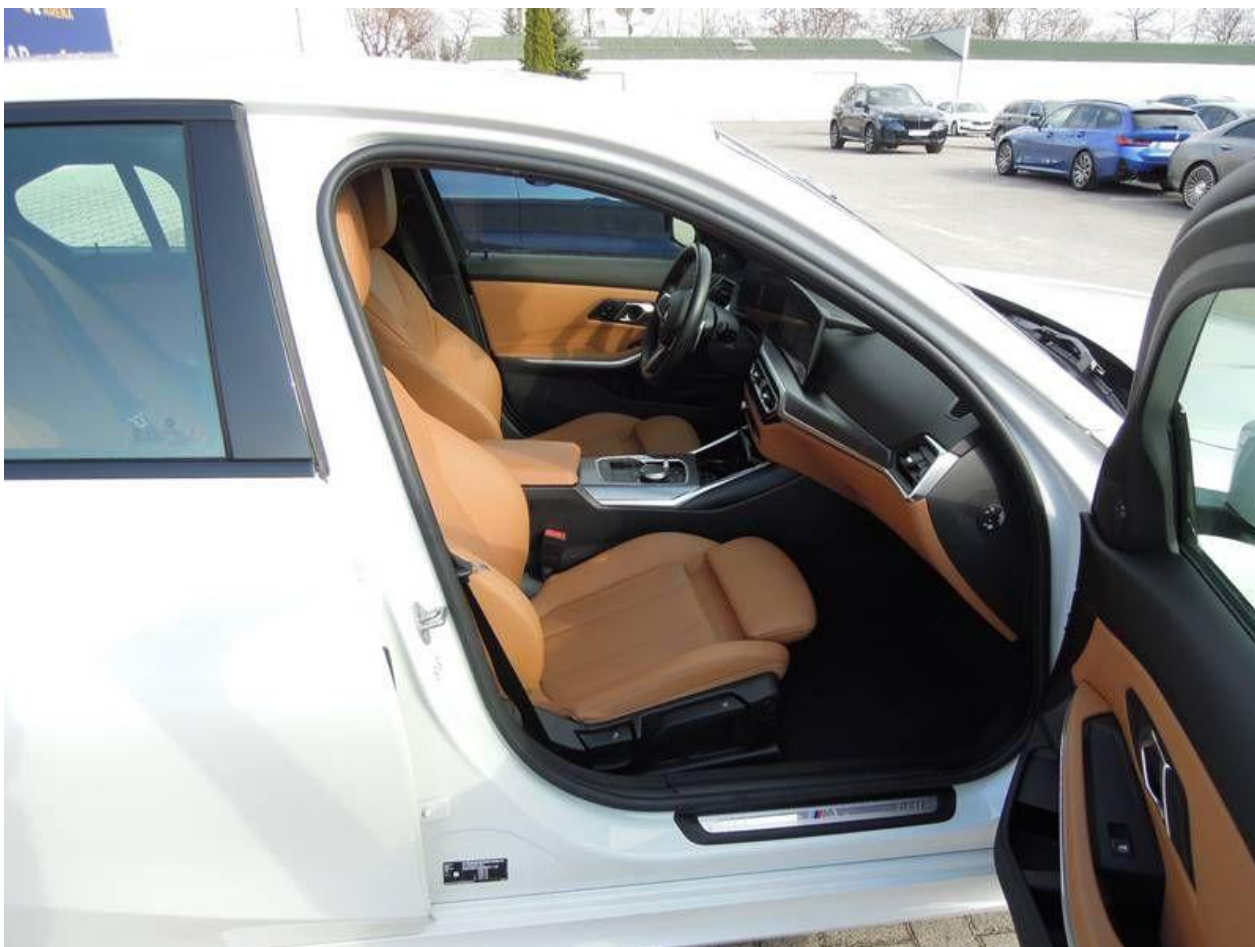
Fot. nr 26