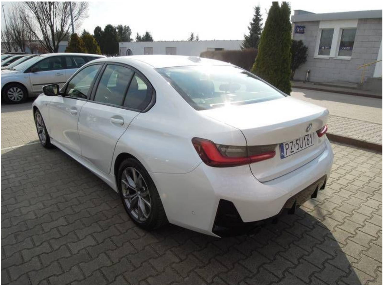
Fot. nr 2