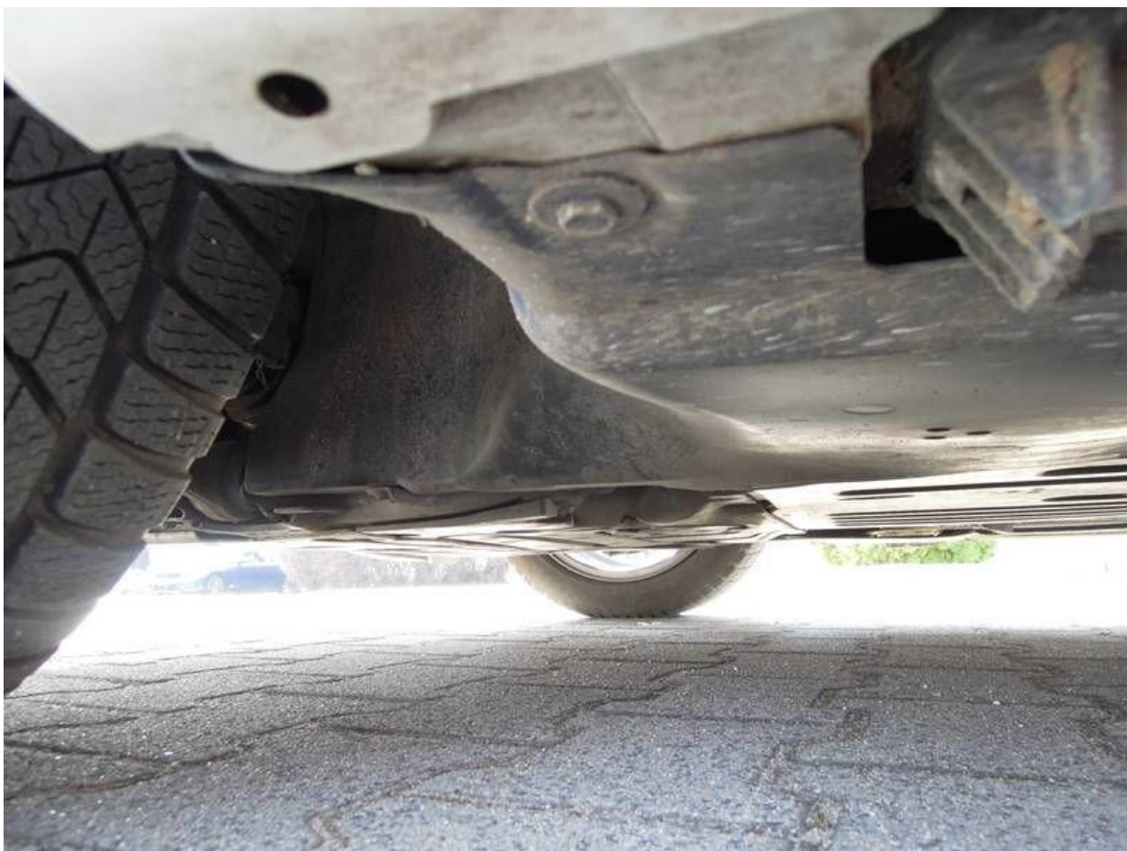
Fot. nr 40