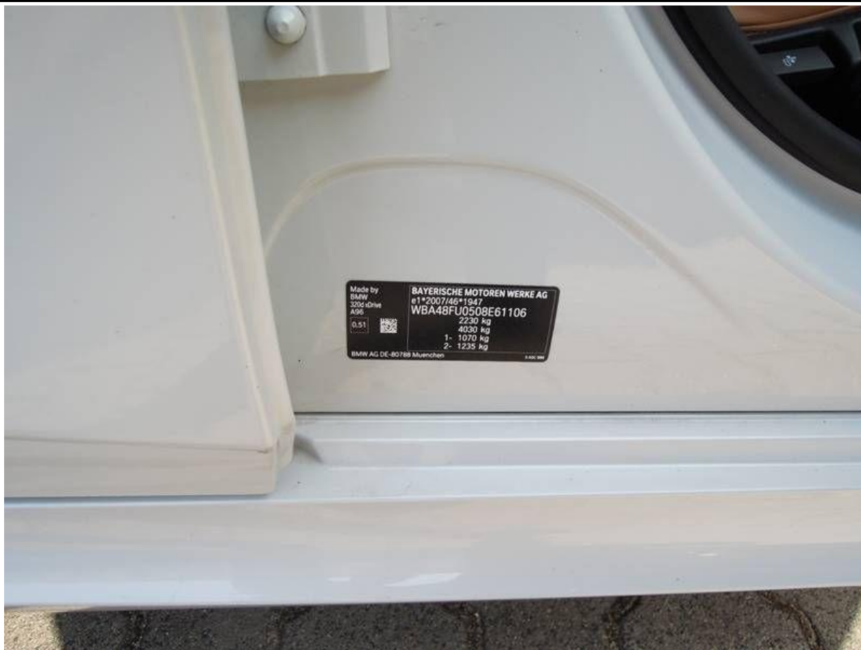
Fot. nr 7