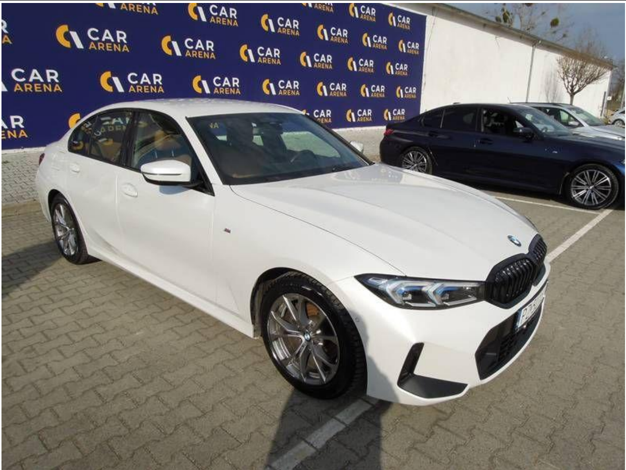
Fot. nr 5