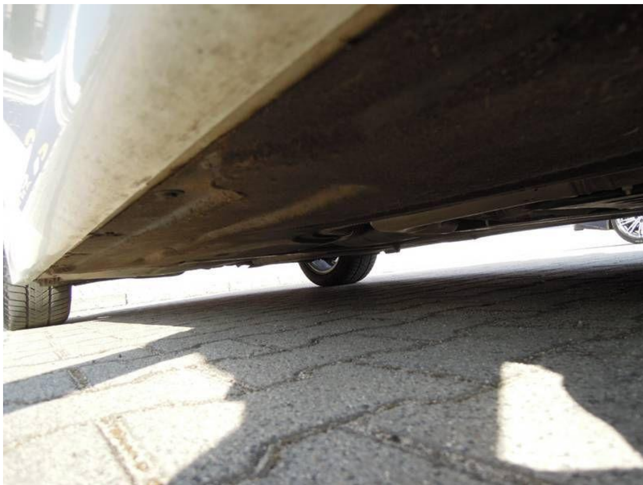
Fot. nr 44