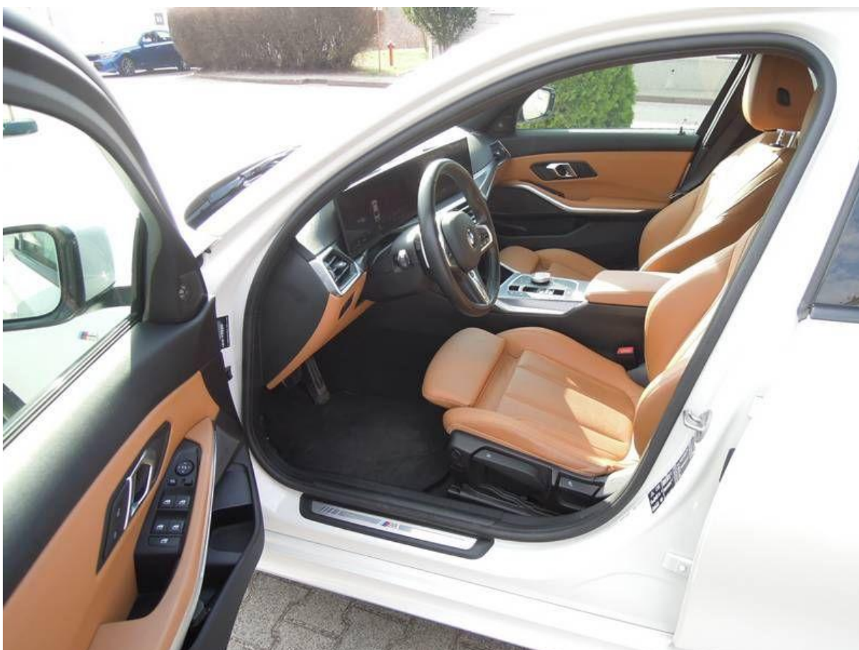
Fot. nr 14