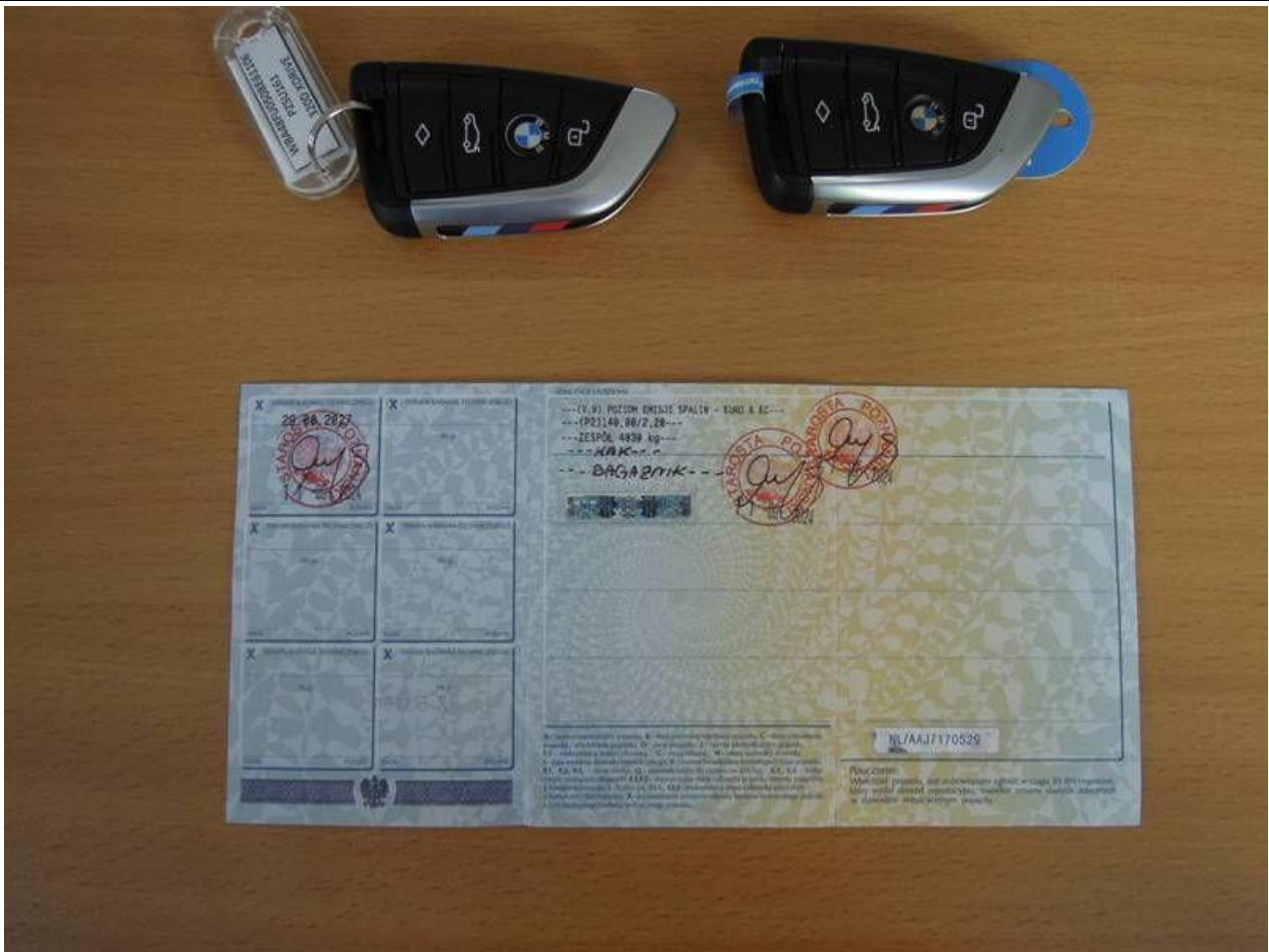
Fot. nr 55

Dokument wystawiony elektronicznie, wa ny bez podpisu