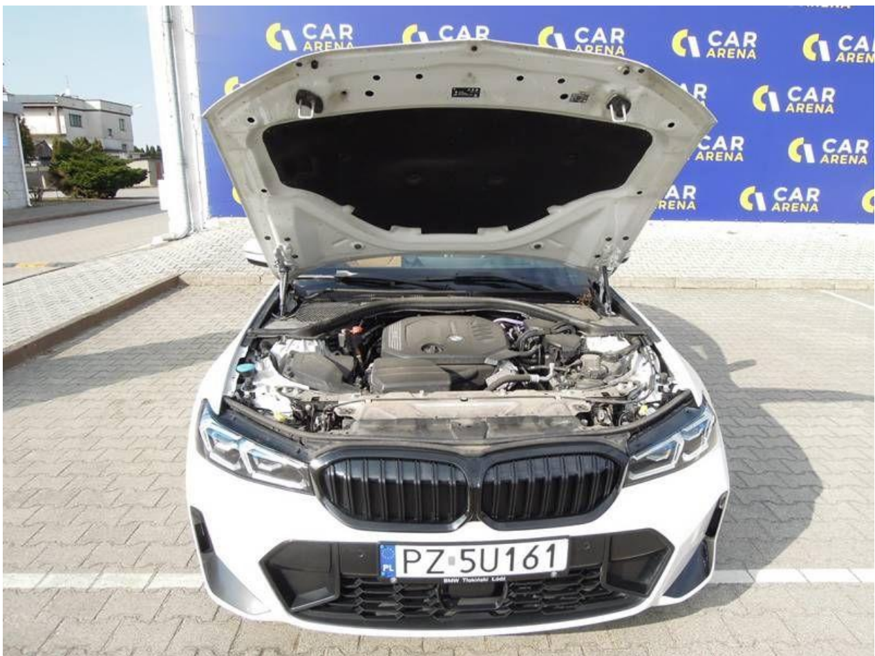
Fot. nr 10