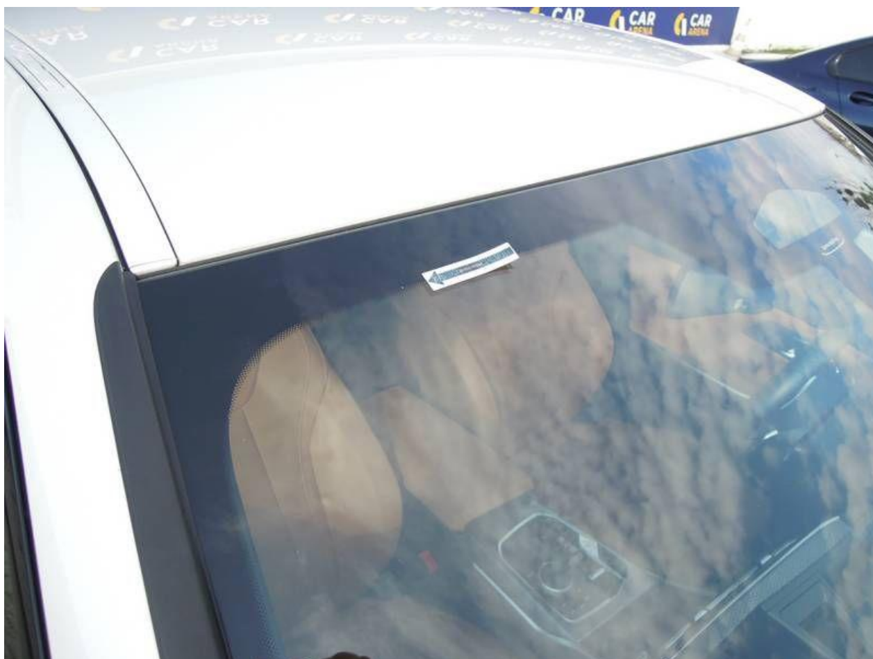
Fot. nr 28