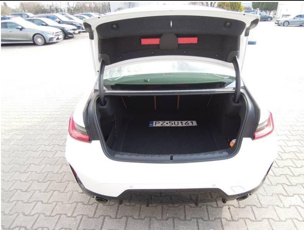
Fot. nr 19