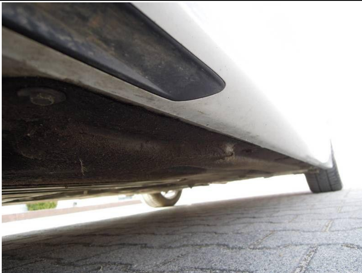
Fot. nr 41