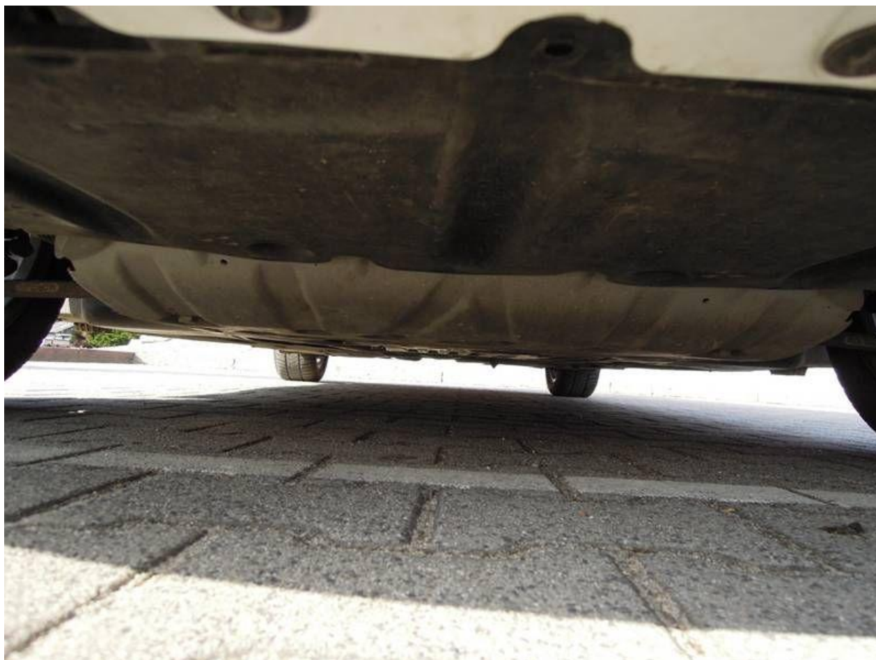
Fot. nr 42