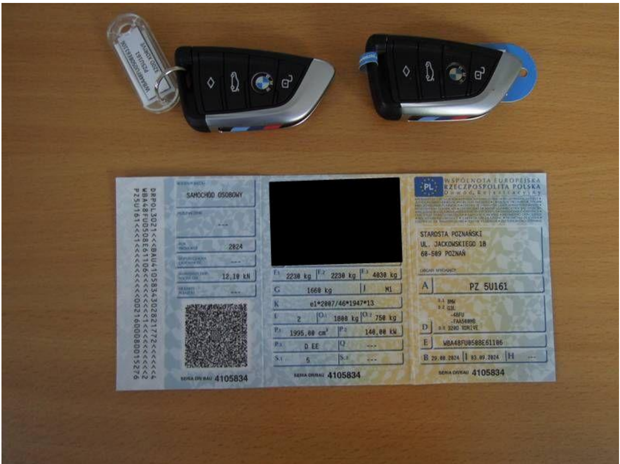
Fot. nr 54