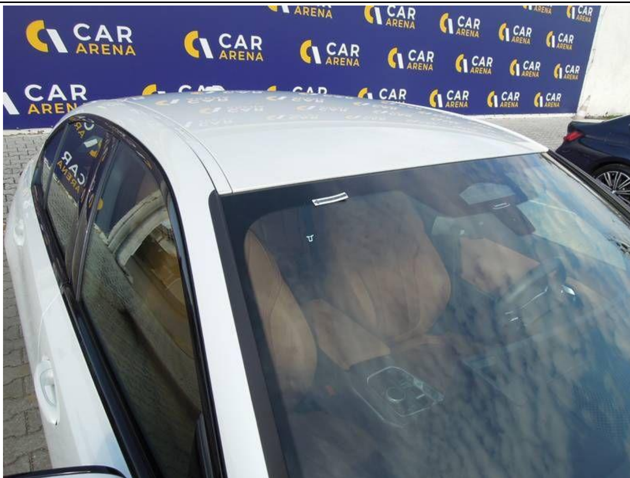
Fot. nr 27