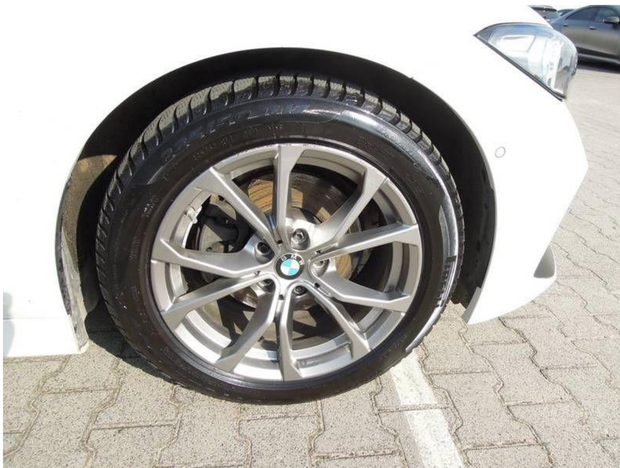
Fot. nr 38