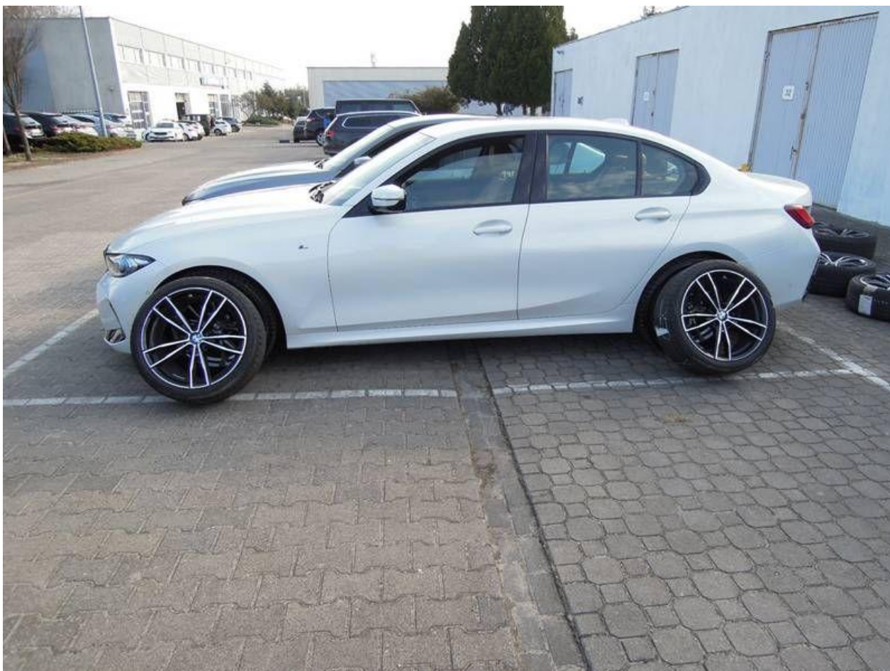
Fot. nr 48