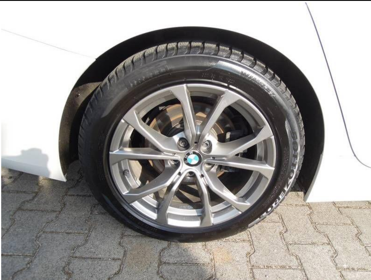
Fot. nr 39