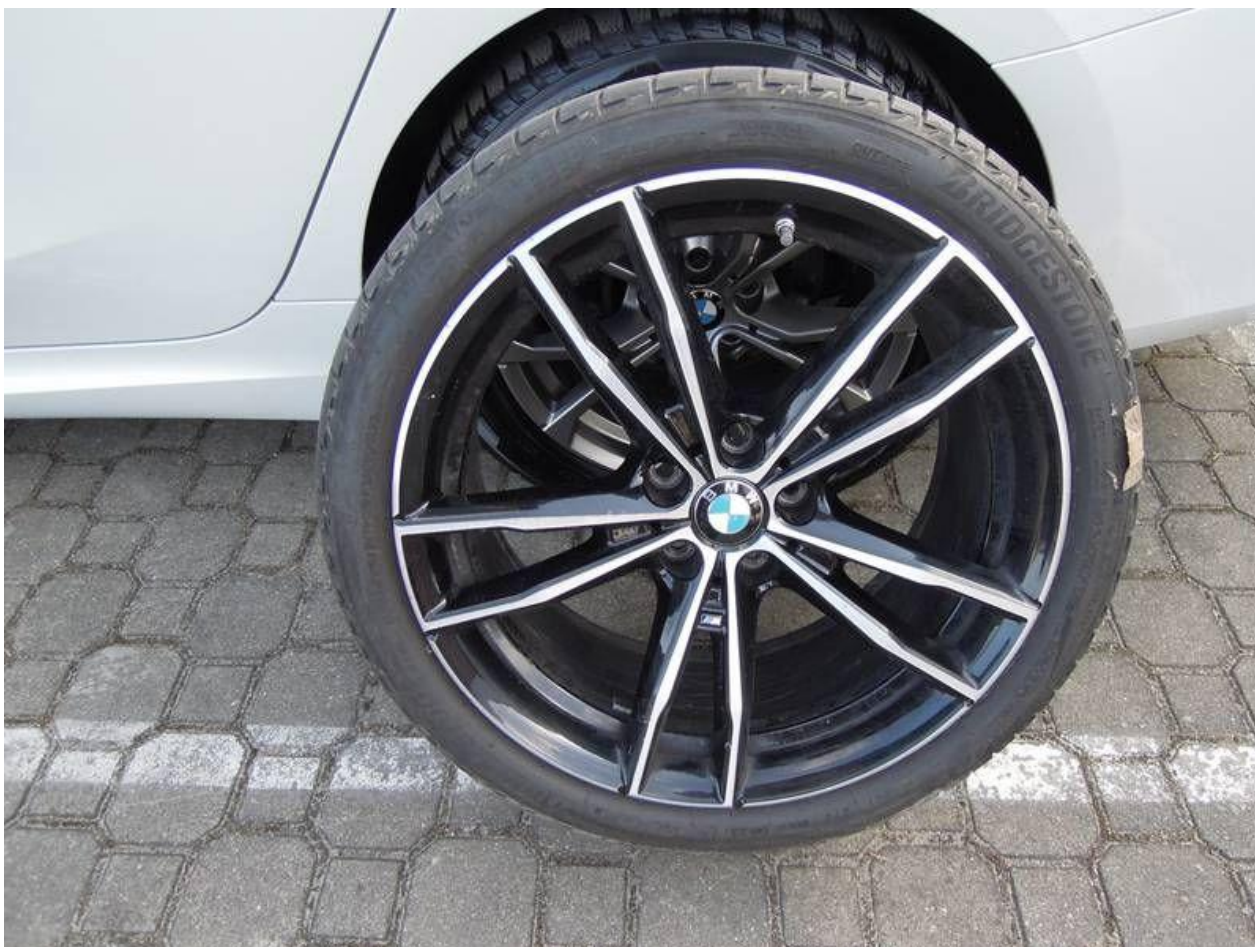
Fot. nr 50