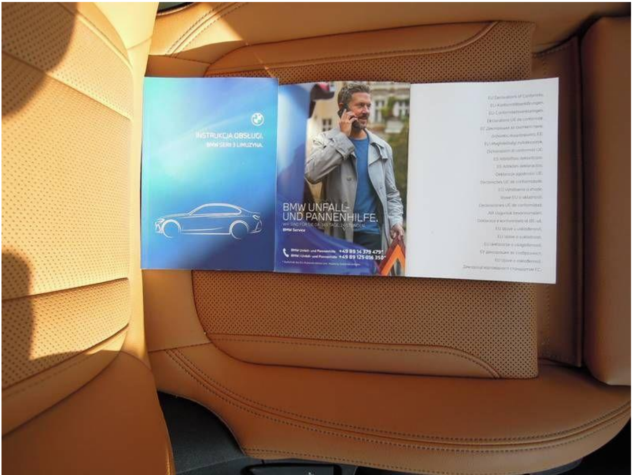
Fot. nr 53