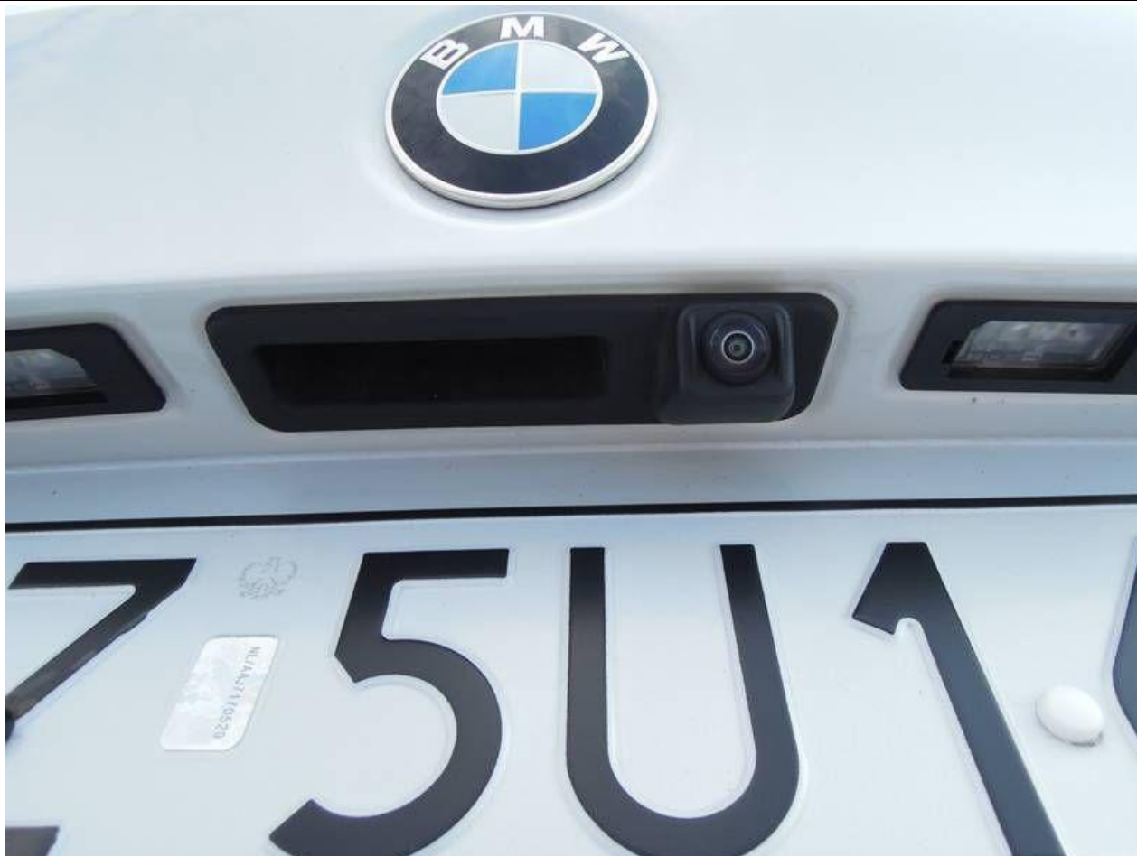
Fot. nr 21