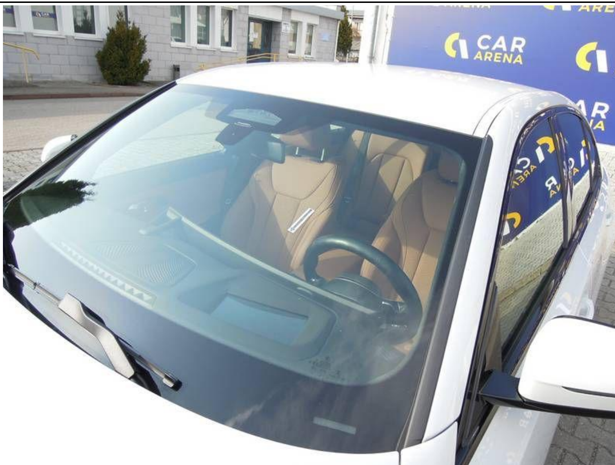
Fot. nr 29