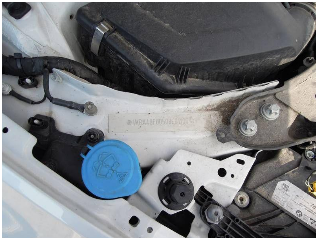
Fot. nr 8