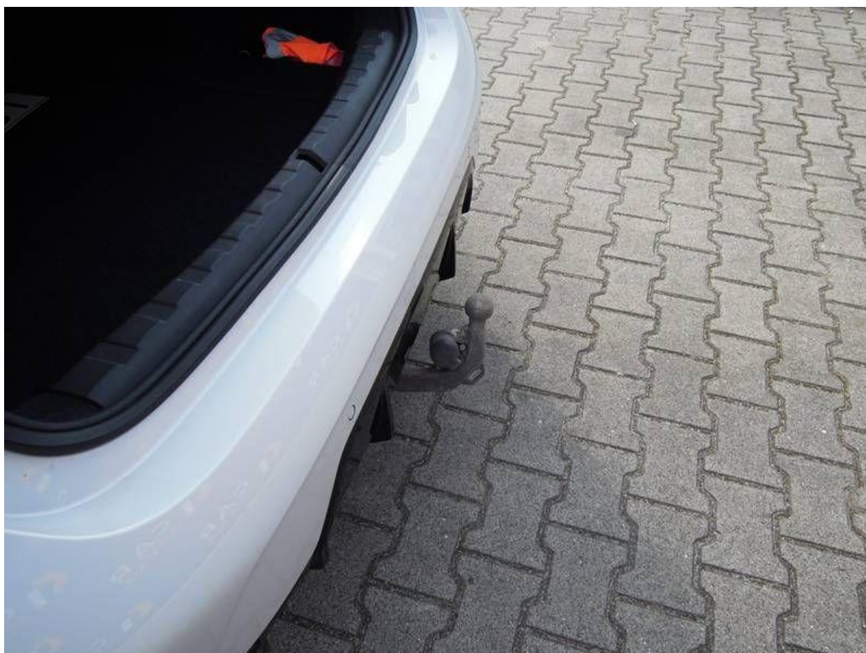
Fot. nr 22