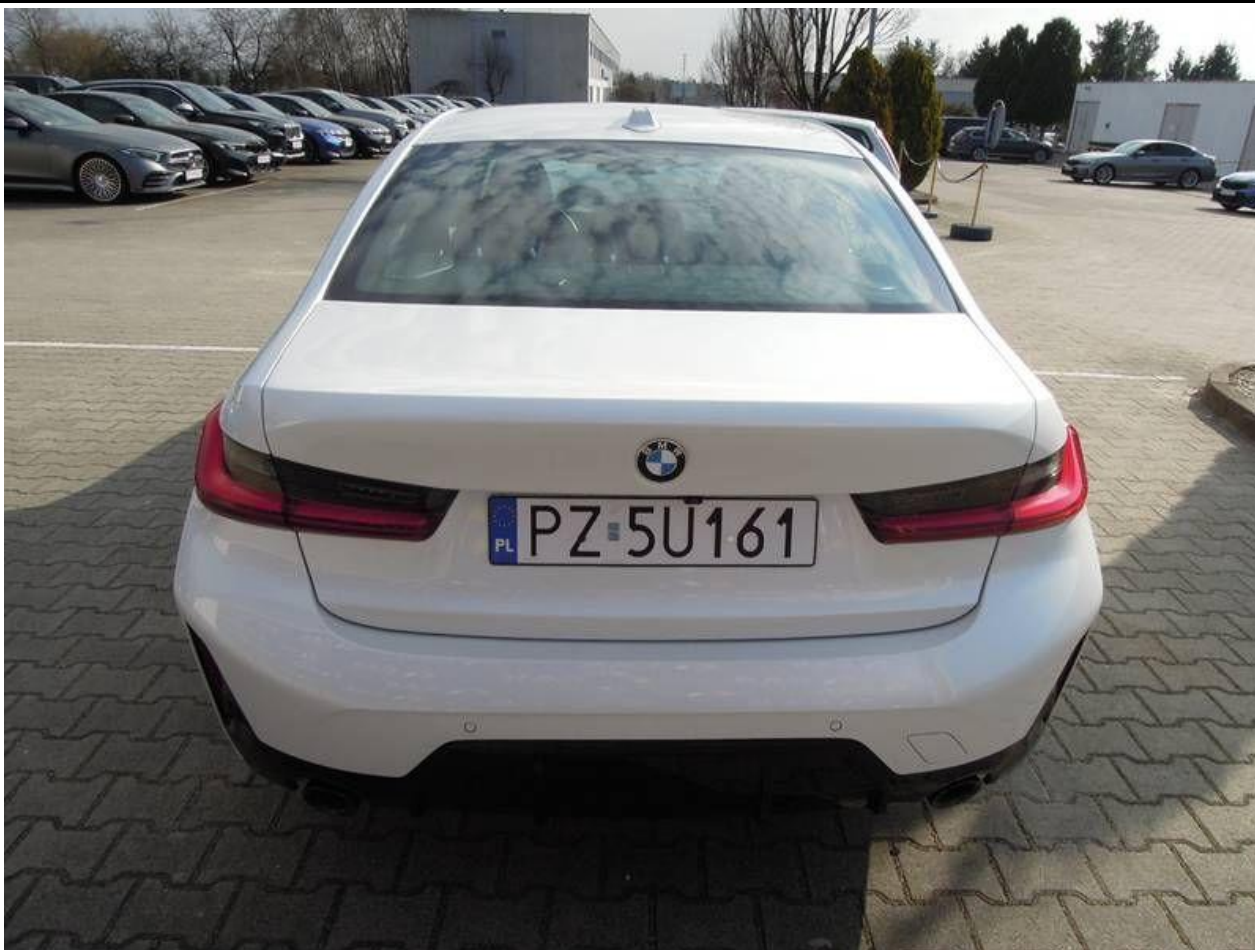
Fot. nr 3