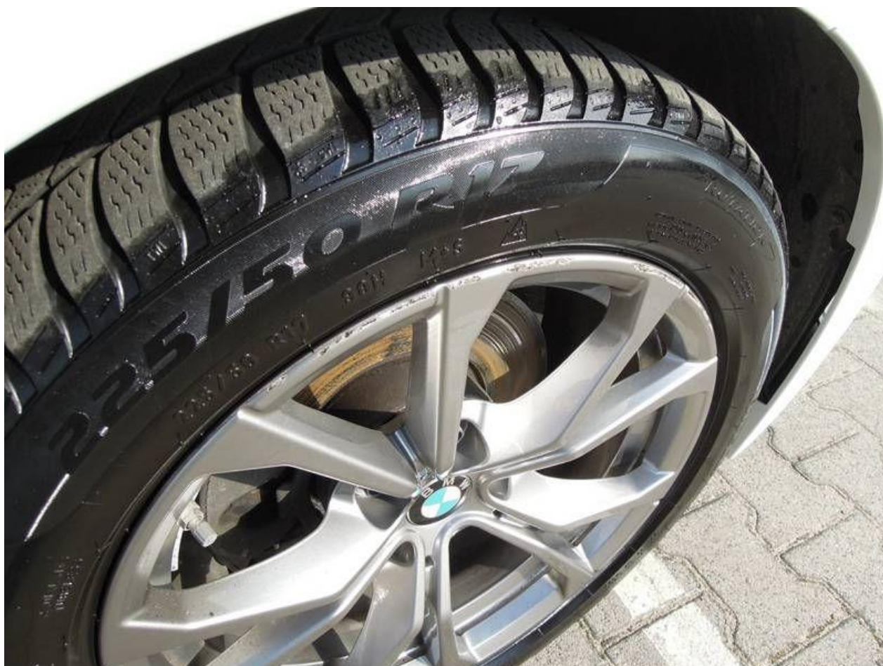
Fot. nr 32