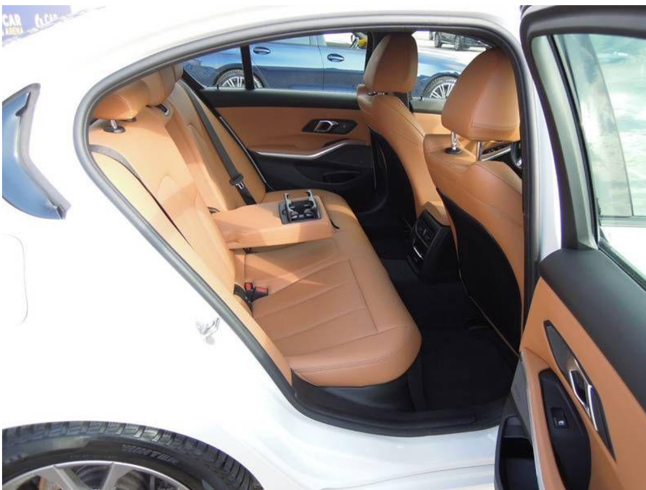
Fot. nr 24