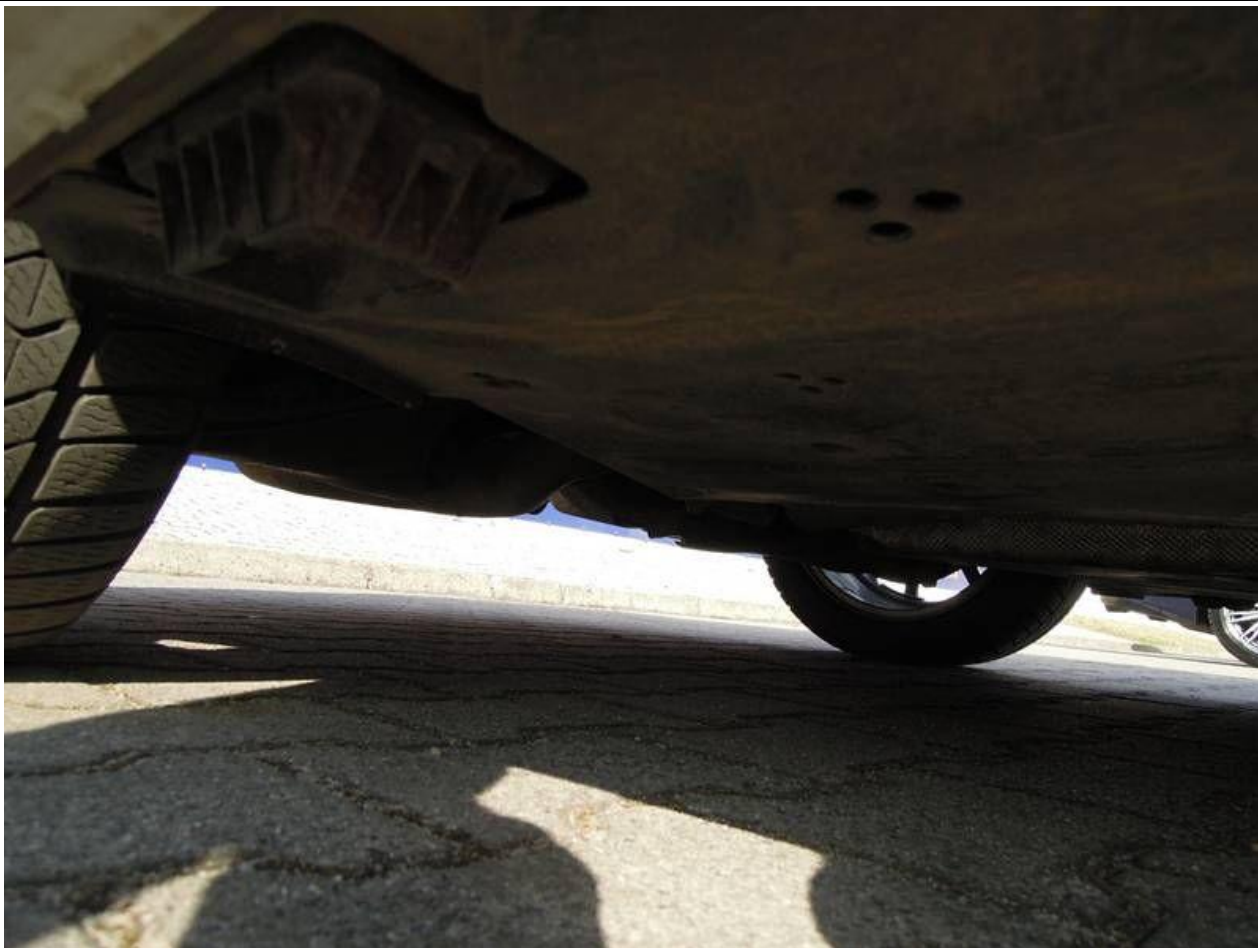
Fot. nr 45