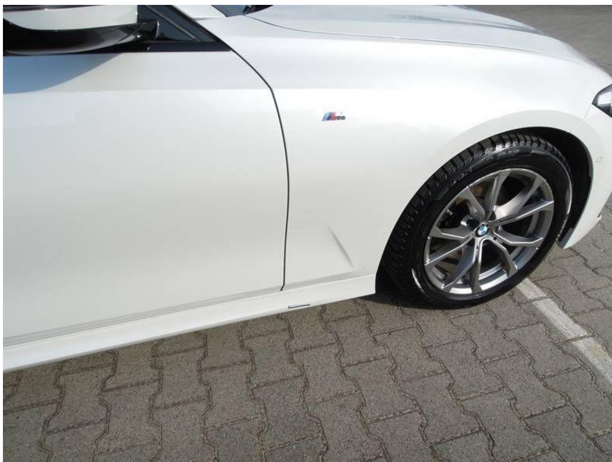
Fot. nr 34