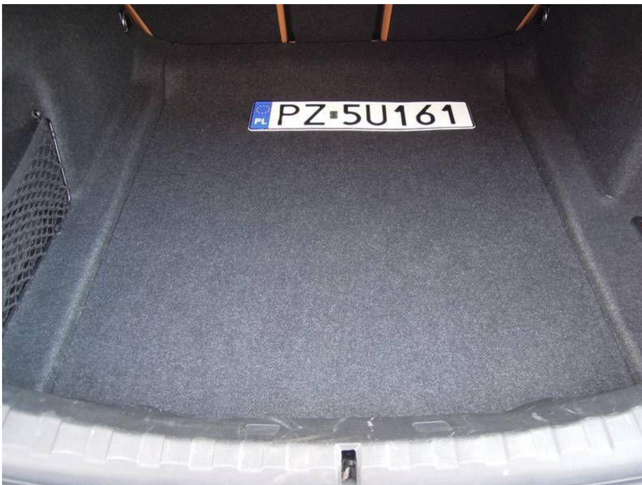
Fot. nr 20