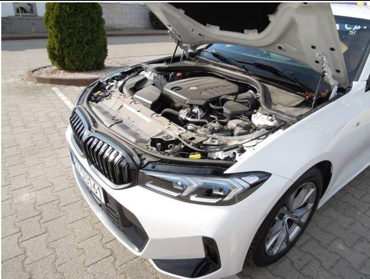
Fot. nr 11