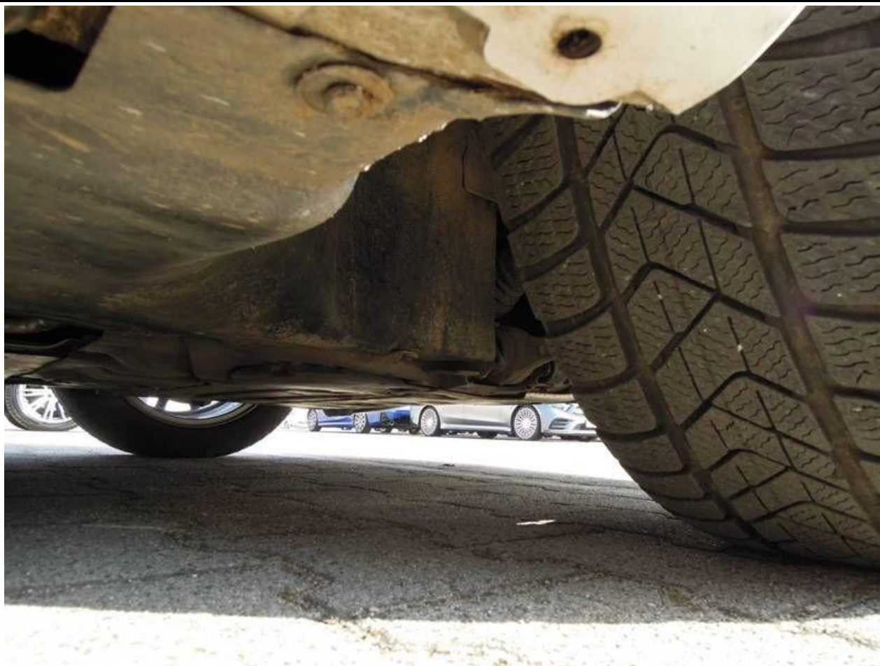
Fot. nr 43