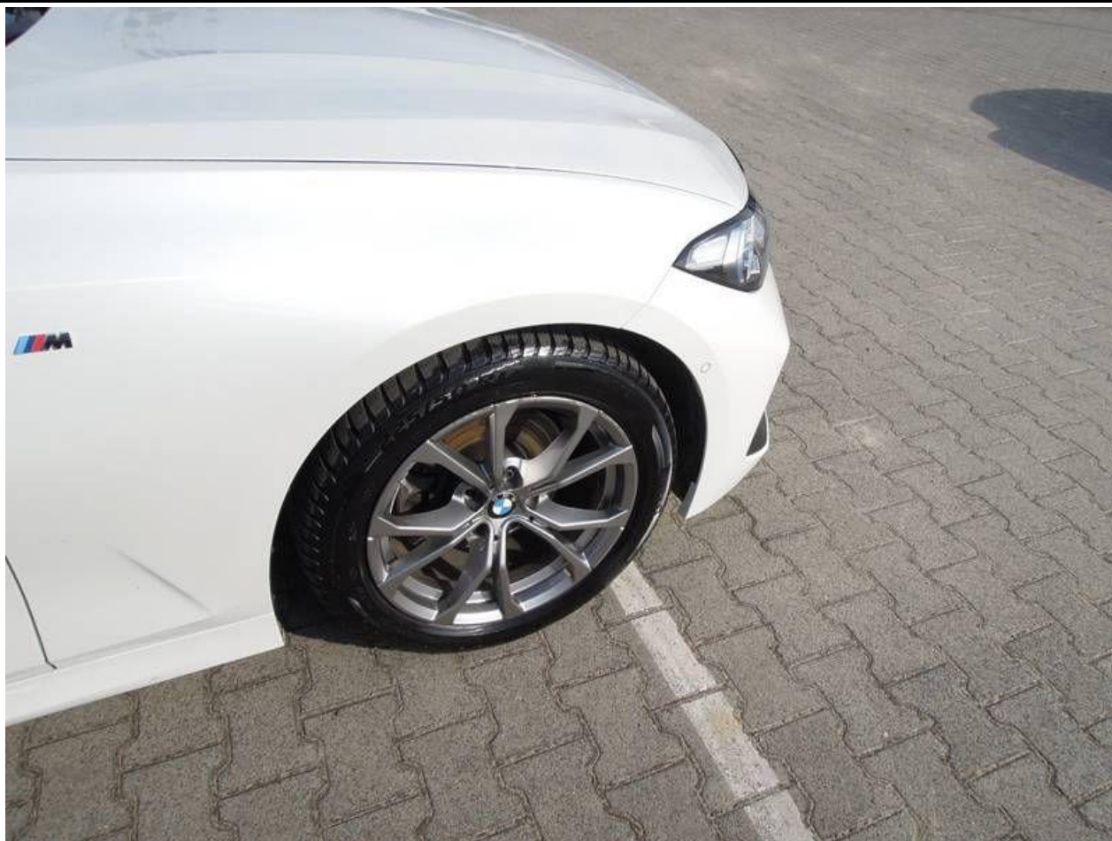
Fot. nr 31