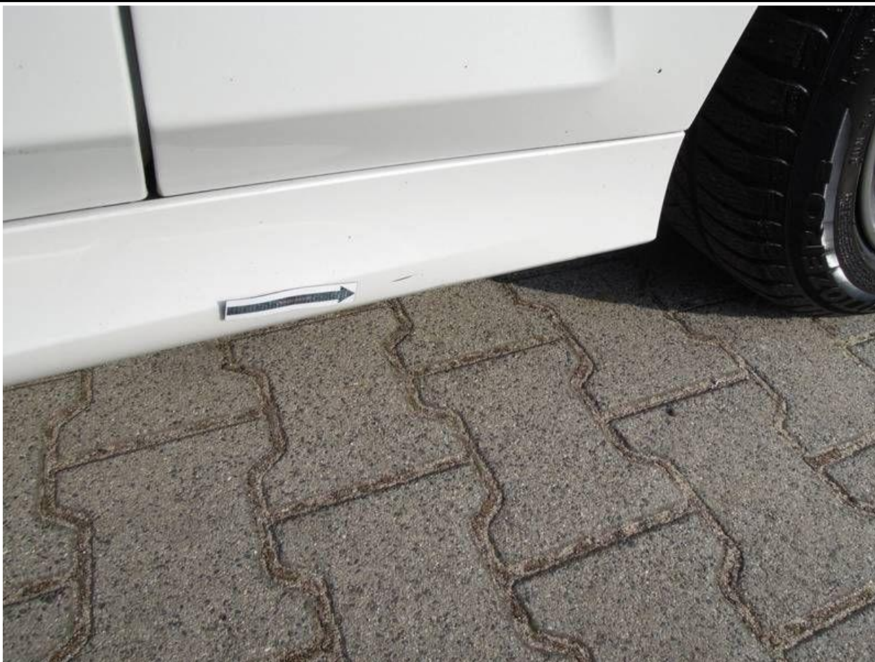
Fot. nr 35