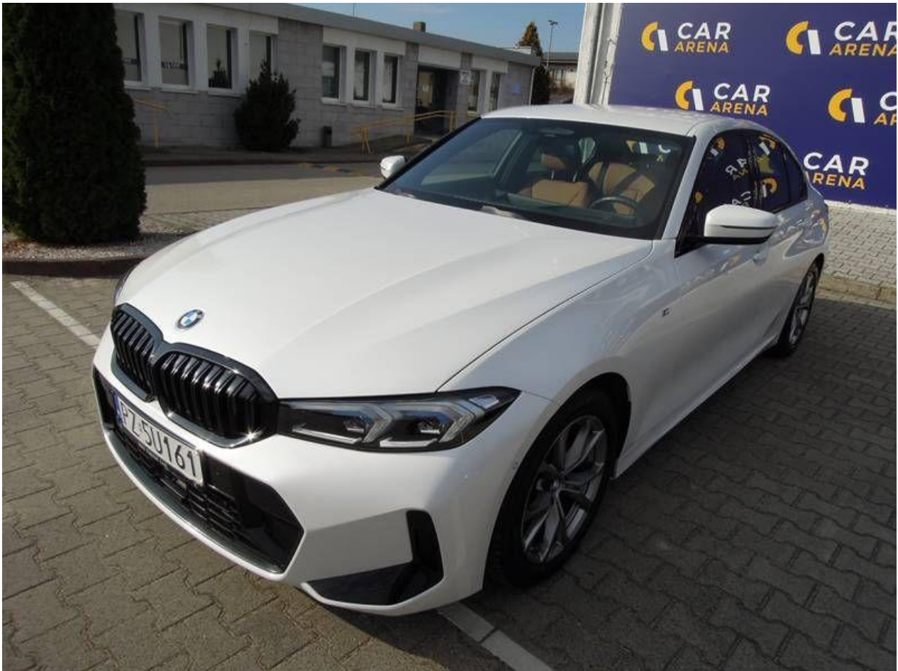
Fot. nr 1