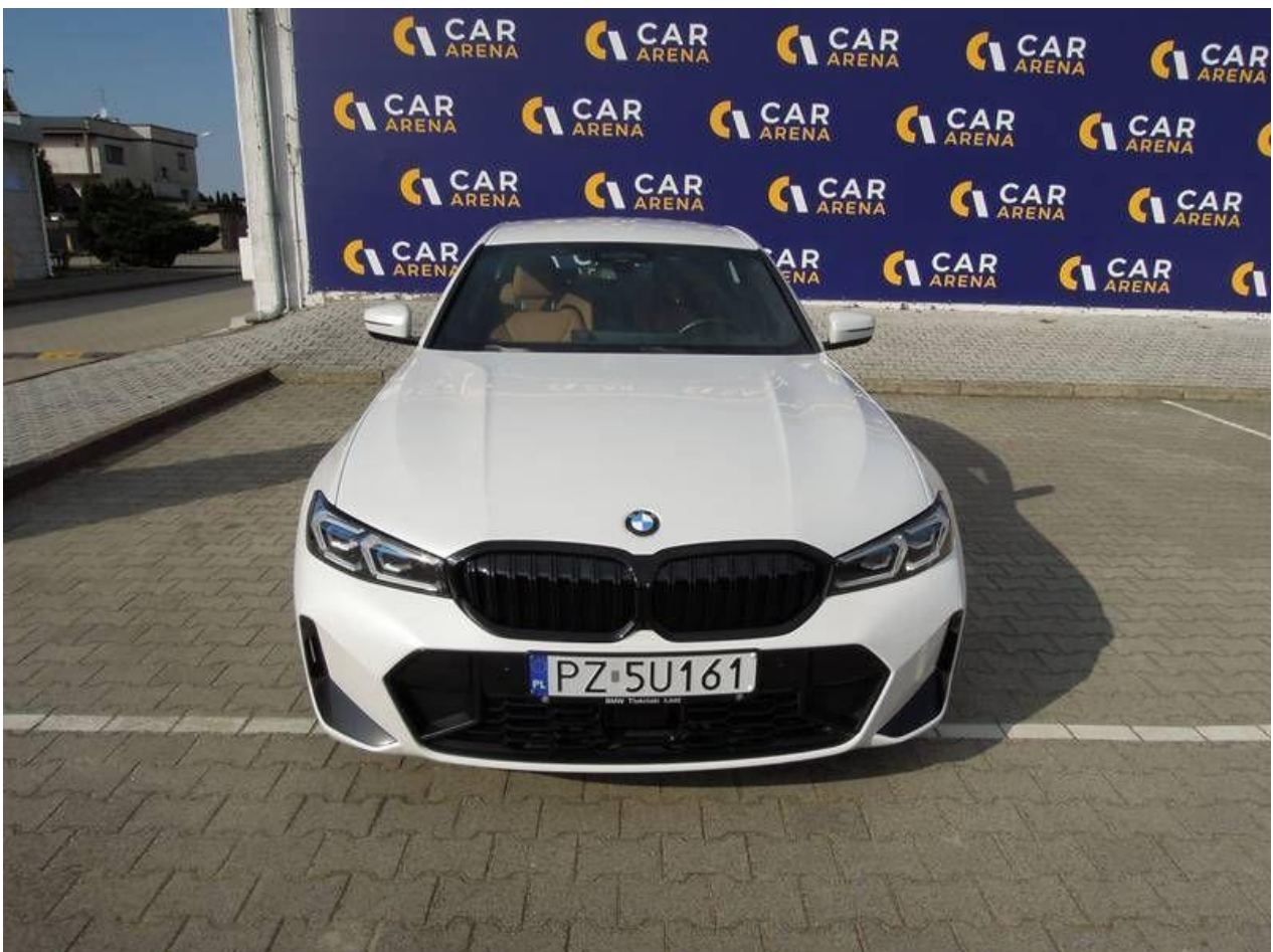
Fot. nr 6