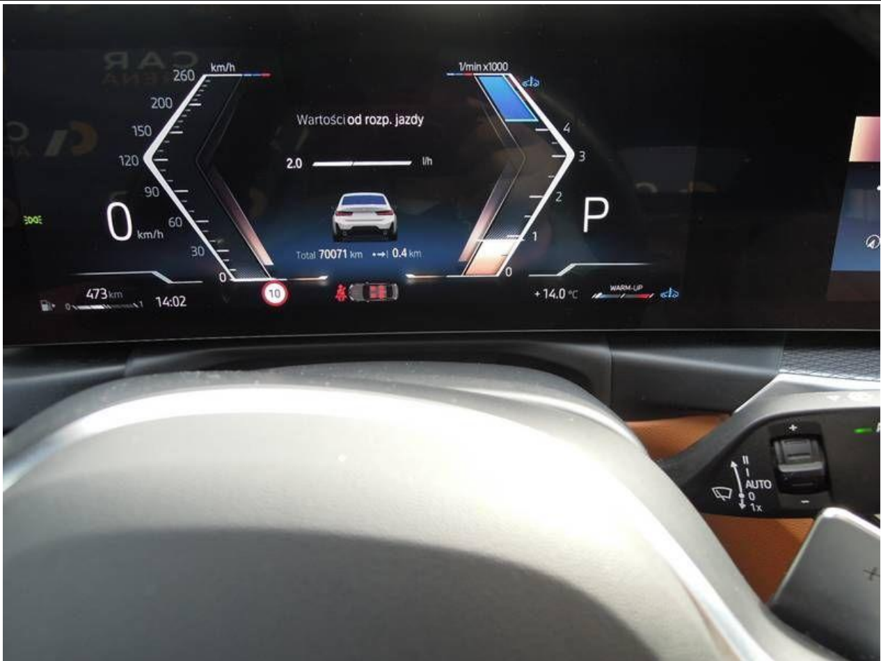
Fot. nr 9