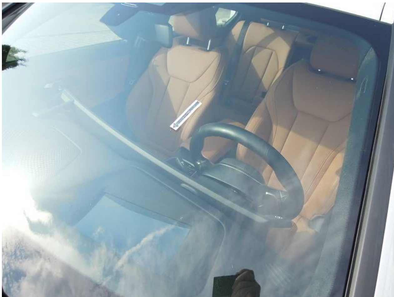
Fot. nr 30