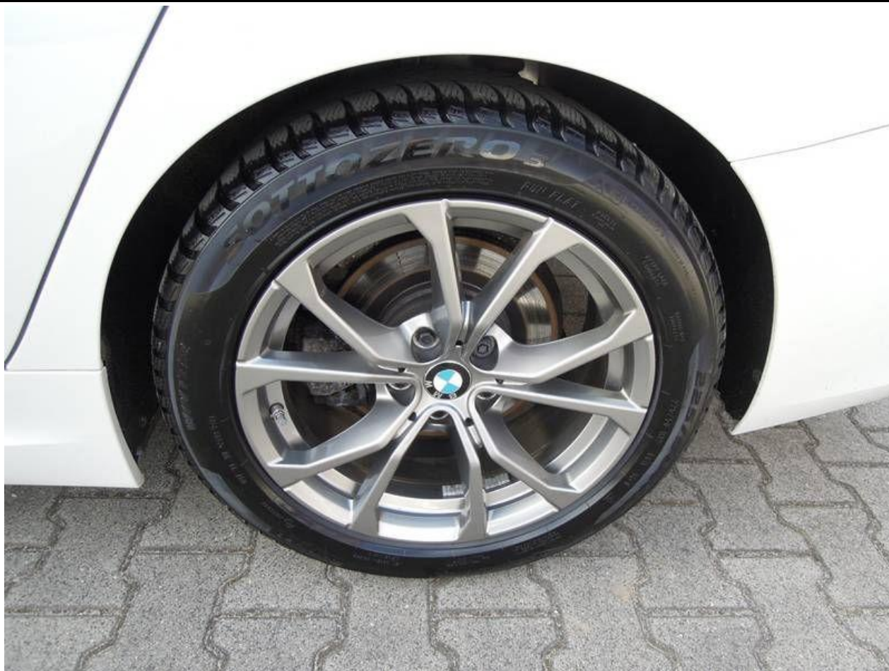
Fot. nr 37