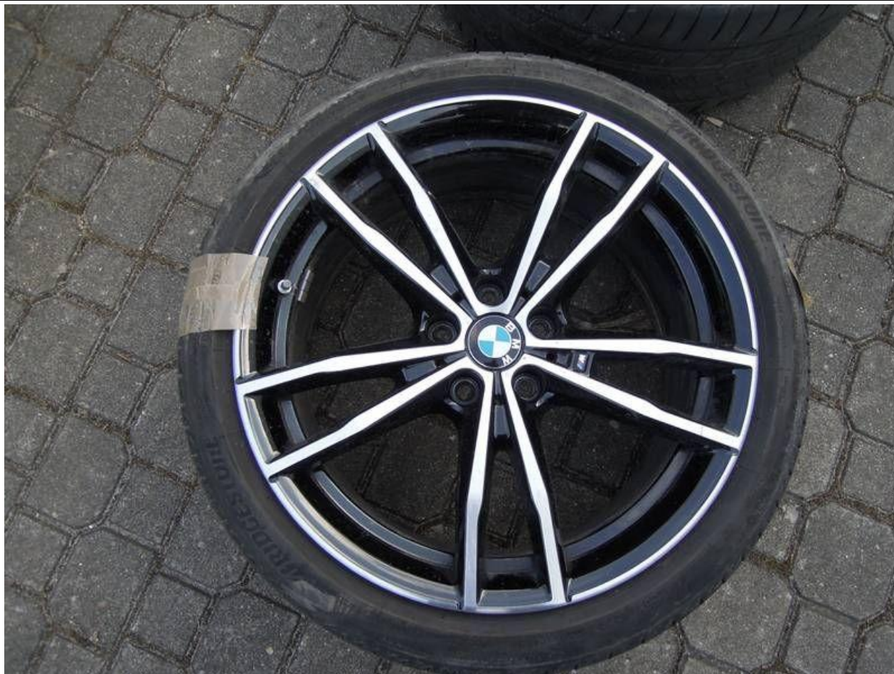
Fot. nr 51