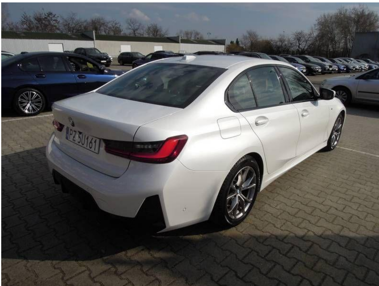
Fot. nr 4