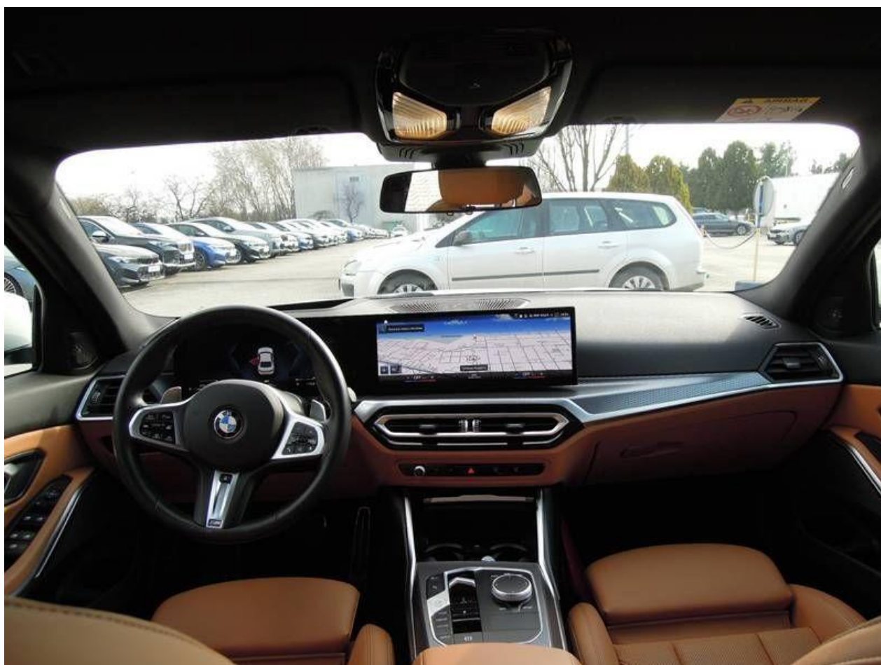
Fot. nr 18