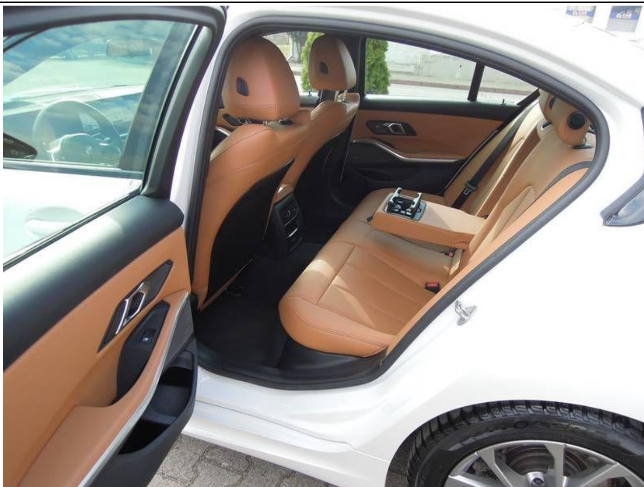
Fot. nr 17