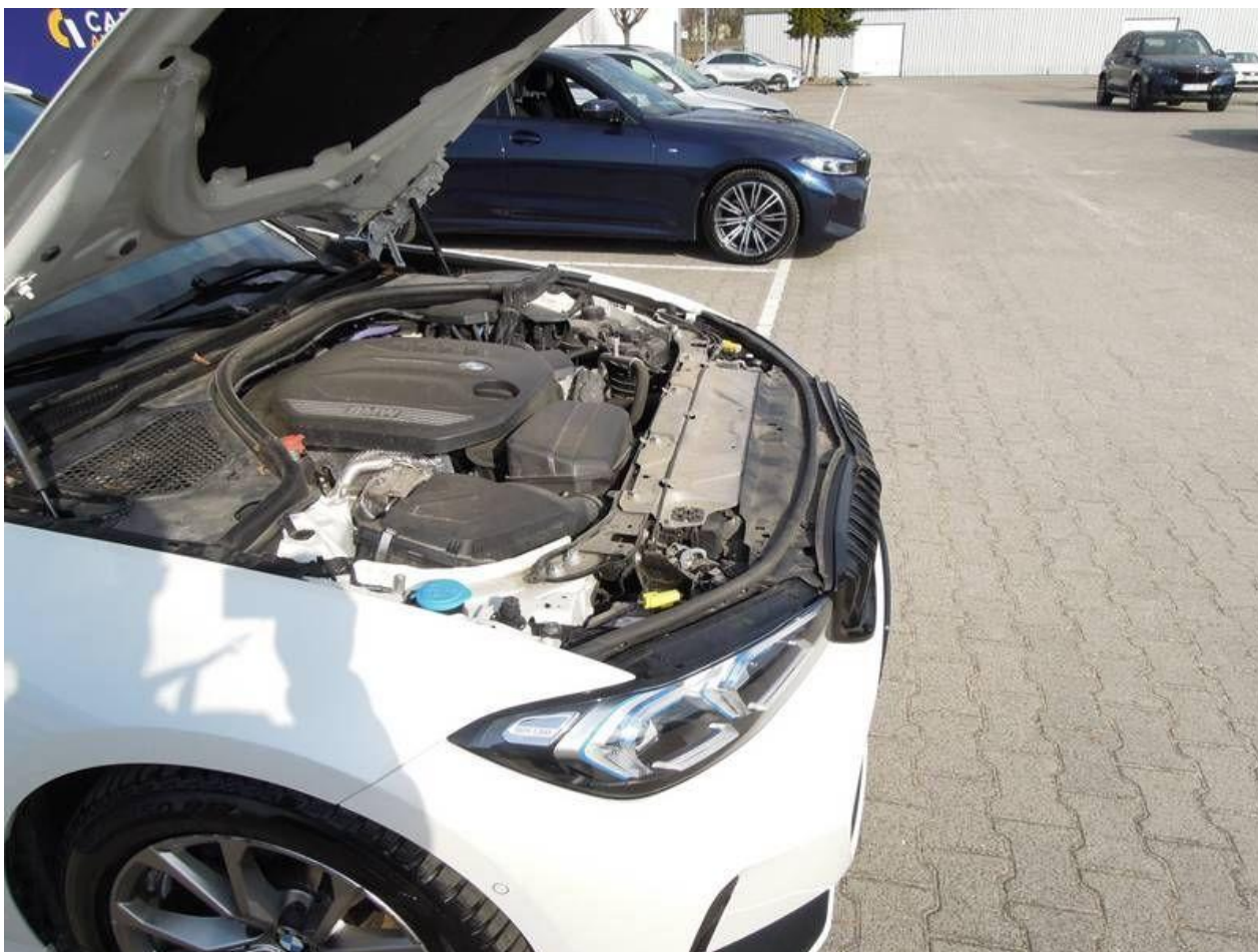
Fot. nr 12