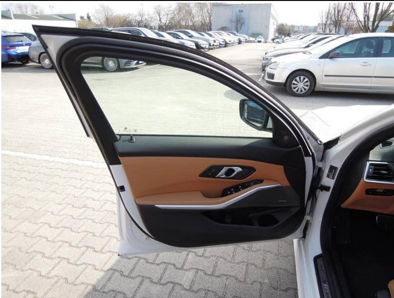
Fot. nr 13