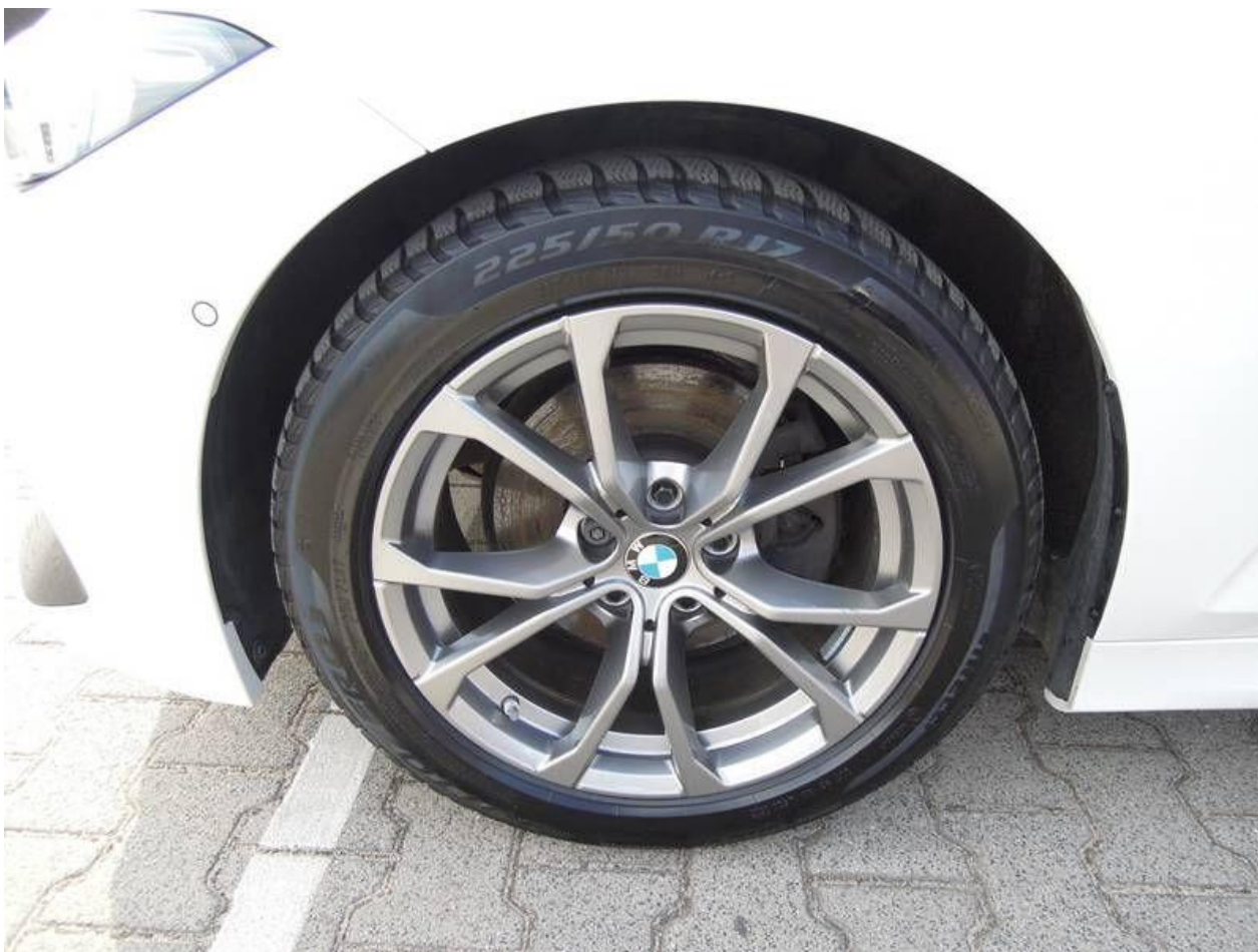
Fot. nr 36