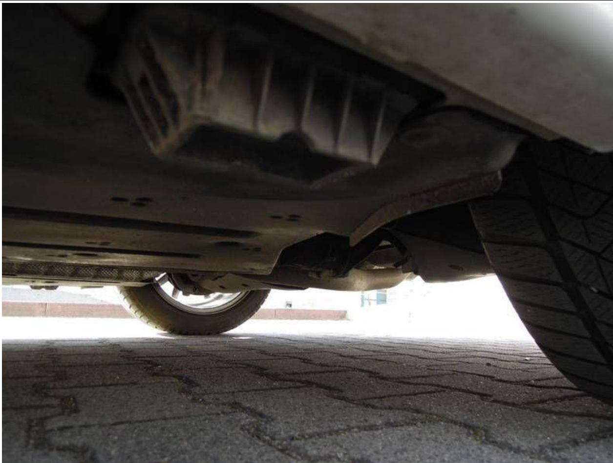
Fot. nr 47