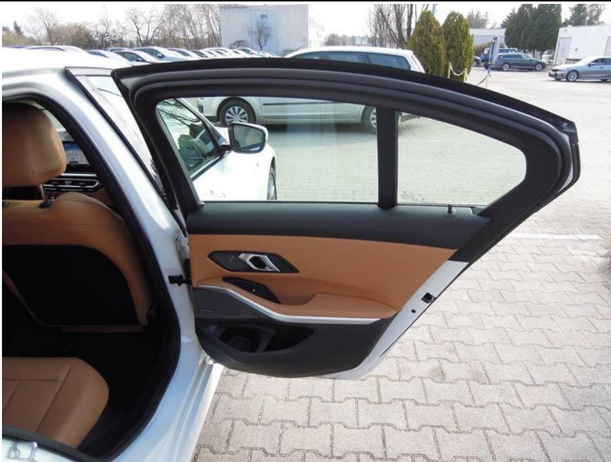
Fot. nr 23