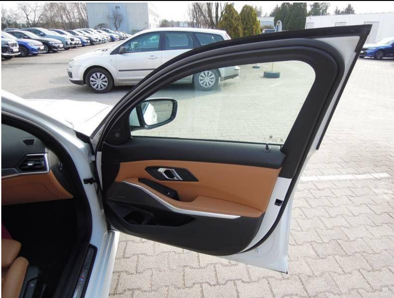
Fot. nr 25